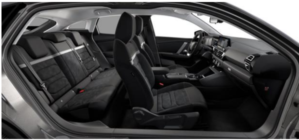
Ambiente Alcantara GREY & Kunstleder BLACK