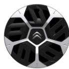
18-Zoll-Stahlfelgen mit Radzierkappen "Aerotech"