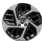
18-Zoll-Leichtmetallfelgen "Aeroblade" Anthra Grau