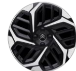
18-Zoll-Leichtmetallfelgen „AEROBLADE“ glanzgedreht