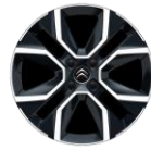
18-Zoll-Leichtmetallfelgen "Crosslight" glanzgedreht