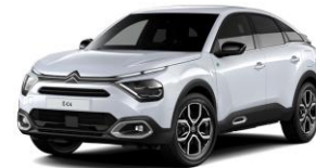
COLOR-PAKET "Glossy Silver"

- Airbump® und Stoßfänger vorne mit grauer Dekorurandung